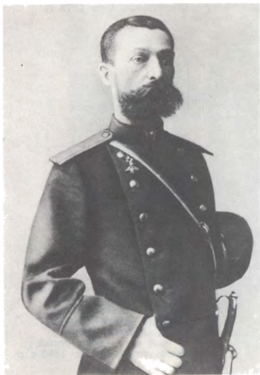
Михаил Ардалъонович Баралев- ский. Фото 1880-х гг.