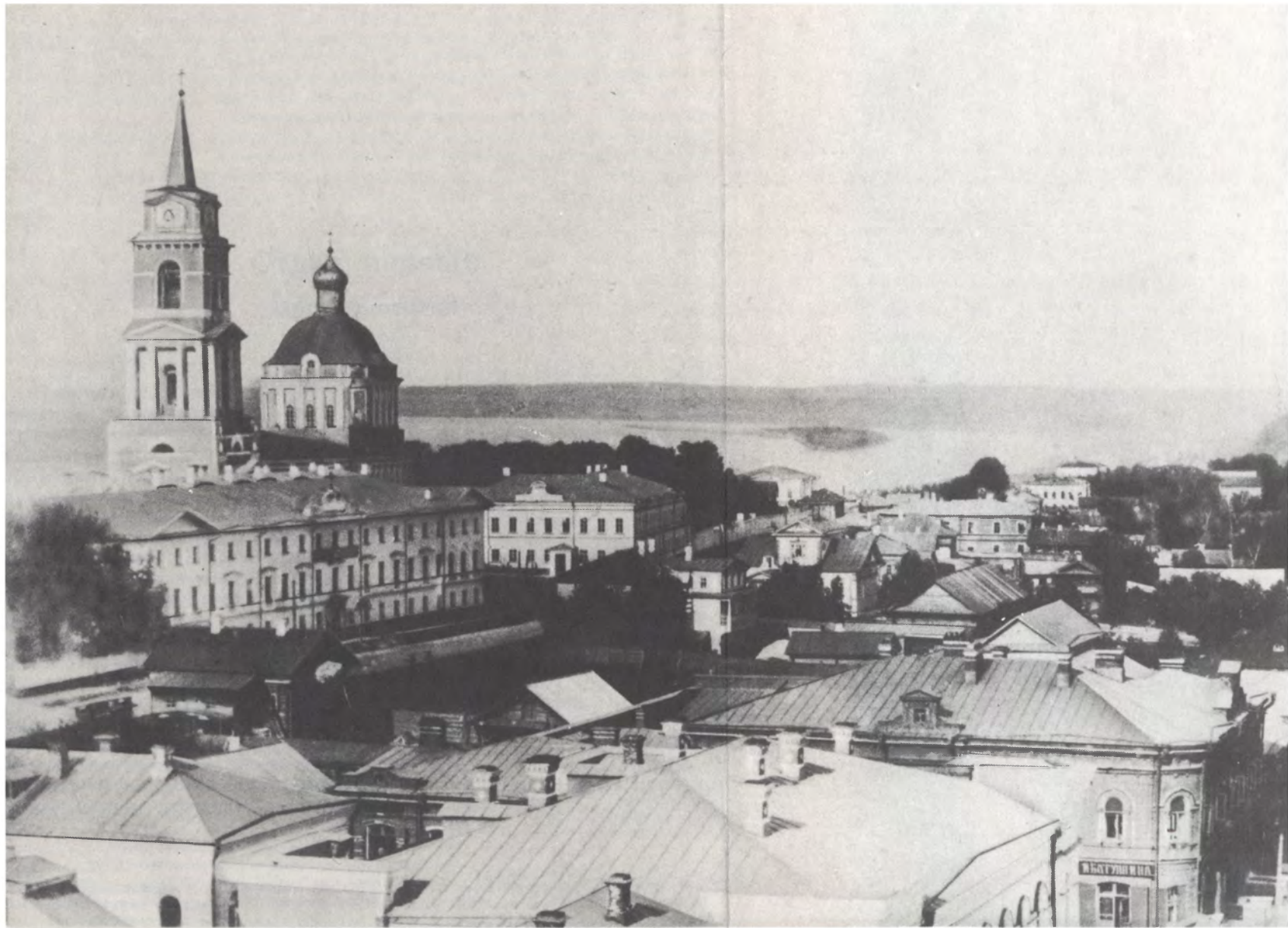
Пермь. Кафедральный собор. Фото 1880-х гг.