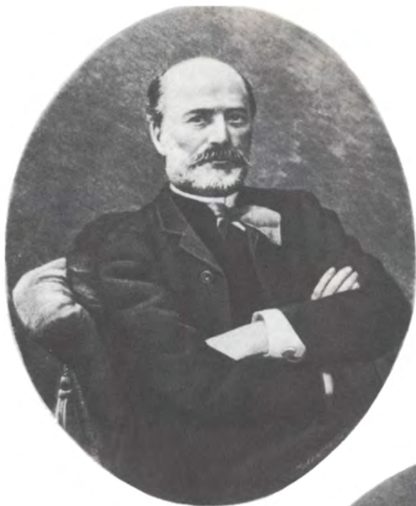
Валерьян Александрович Панаев. Фото 1880-х гг.