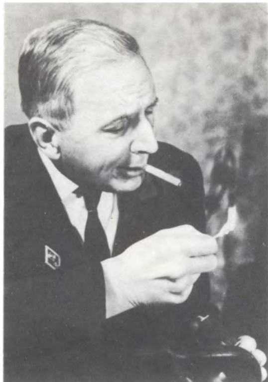
Сергей Валентинович Дягилев. Фото 1963 г.