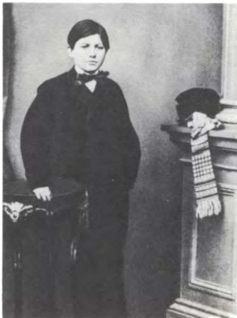
Павел Павлович Дягилев. Фото нач. 1860-х гг.