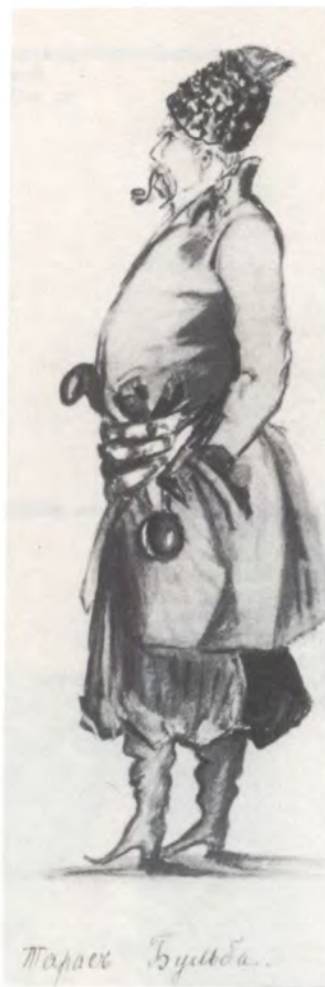
Павел Павлович Дягилев в костюме Тараса Бульбы. Акварель. 1880-е гг.