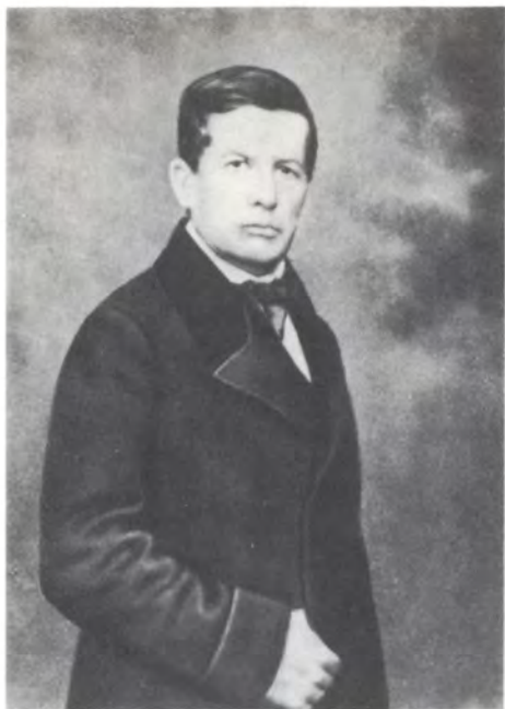
Павел Дмитриевич Дягилев. Фото нач. 1850-х гг.