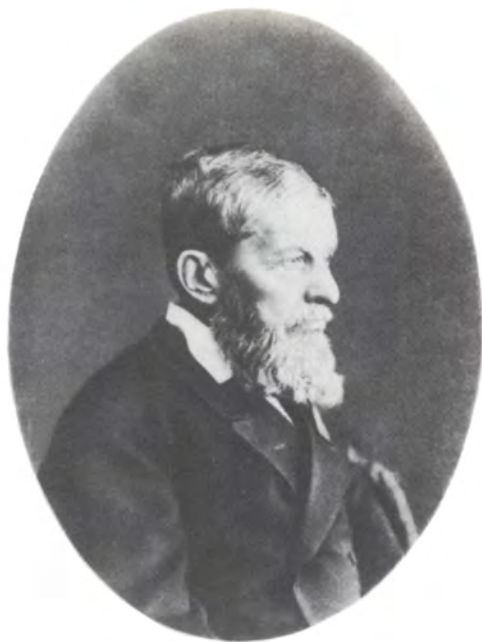
Павел Дмитриевич Дягилев. Фото 1870-х гг.